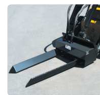
Gabel für Holzstämmе