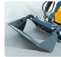
4 in 1 Schaufel