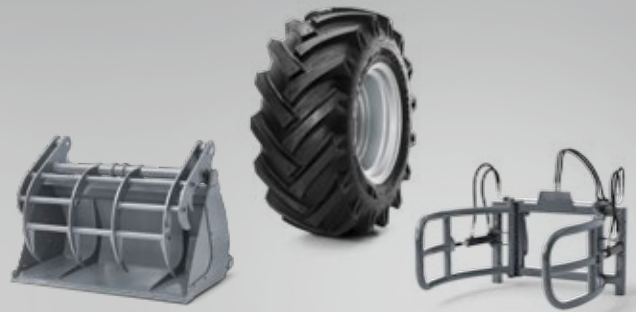
Anbaugeräte und Bereifung. Ihre Weidemann Maschine wird zum Multitool! Für jede Aufgabe das optimale Anbaugerät und die passende Bereifung.