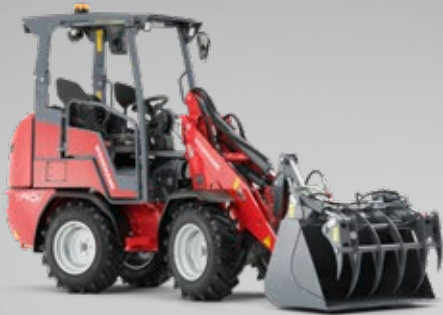
Die multifunktionalen Hoftracs®. Kraftvolle Helfer für jeden Einsatzzweck.