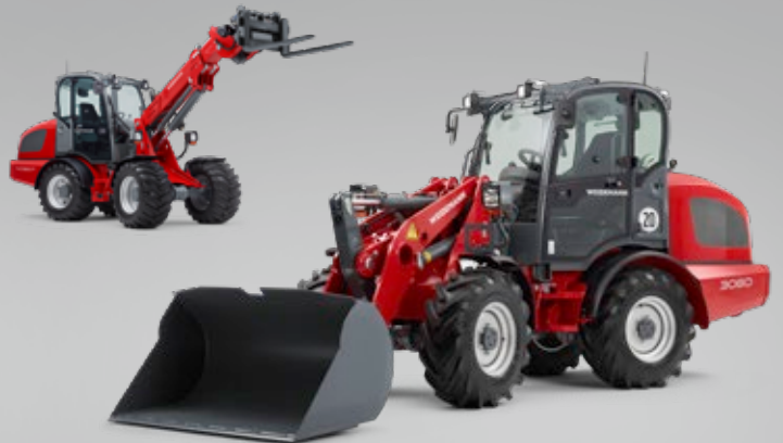
Die kraftvollen Radlader. Wahlweise mit Ladeschwinge oder Teleskoparm.