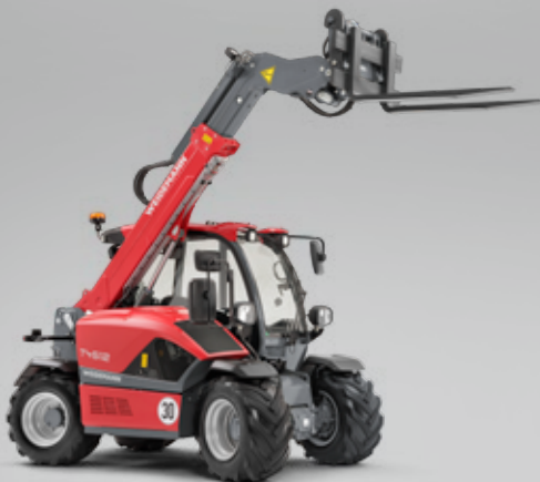
Die kompakten Teleskoplader. Hoch hinaus mit optimaler Standsicherheit.